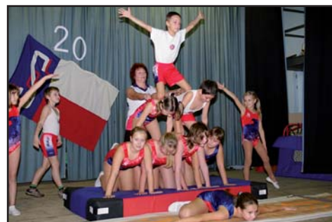
Cvičení žáků ZŠ oddíl všestrannosti