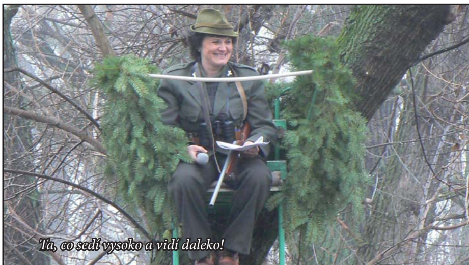
Ta, co sedí vysoko a vidí daleko!