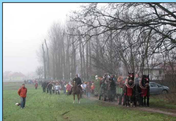
Silvestrovský průvod na myslivnu

Vacenovický zpravodaj vydává Obecní úřad Vacenovice, 696 06 Vacenovice 243.