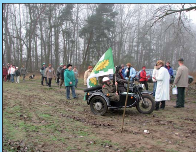
Silvestr - celní kontrola