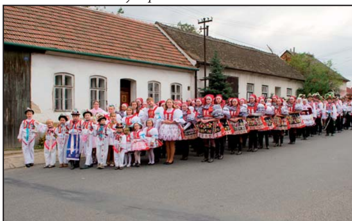
Hody 2010 průvod