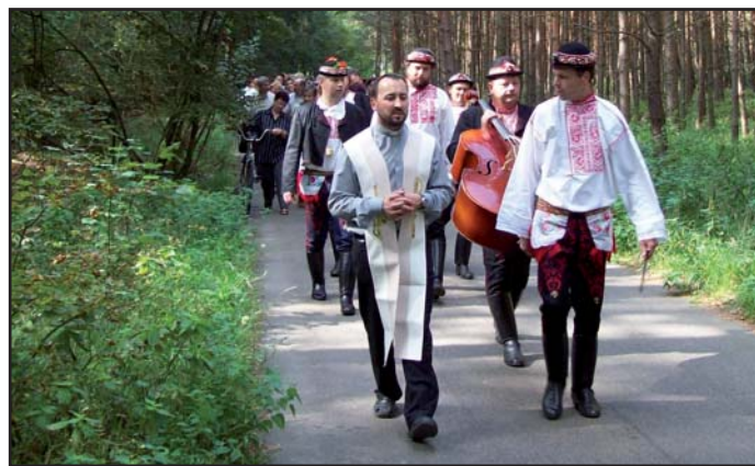
Žehnání kříže 12. září 2010