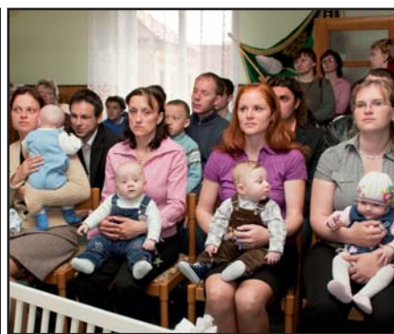
Vítání do života 24. 4. 2010