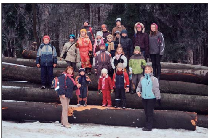
Dětský soubor Oskoruška-soustředění Koryčany, výšlap na Cimburk