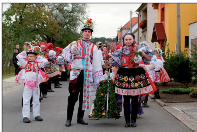
Hody 2010 stárek a stárka