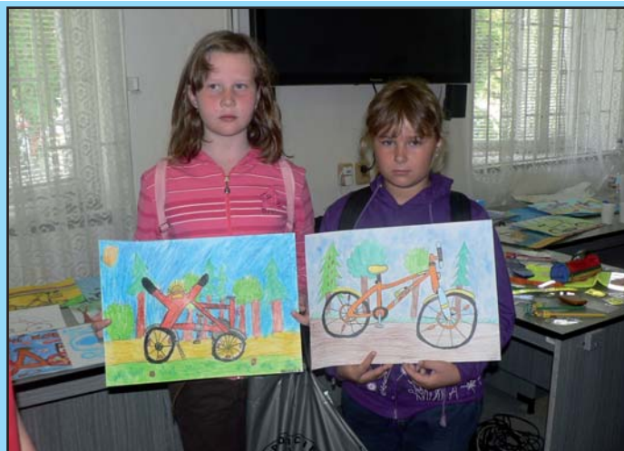
Výherkyně výtvarné soutěže - Kapka prevence