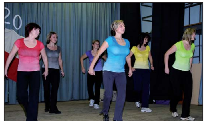
Oddíl aerobiku ženy