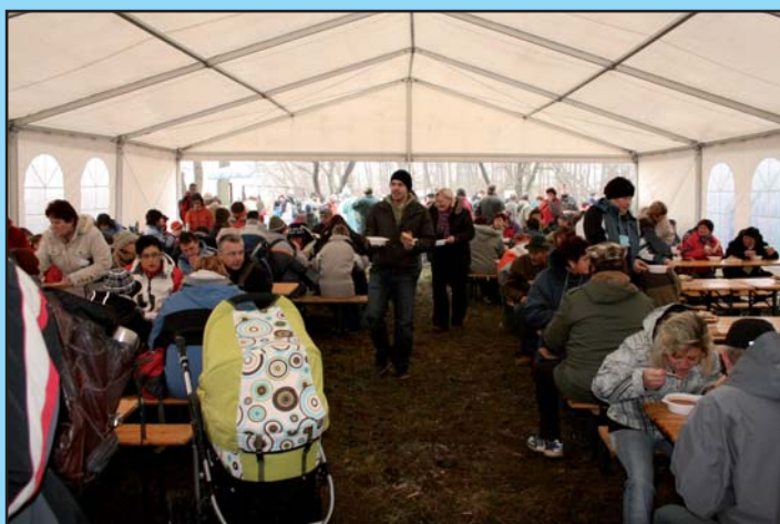
Výborný silvestrovský gulášek