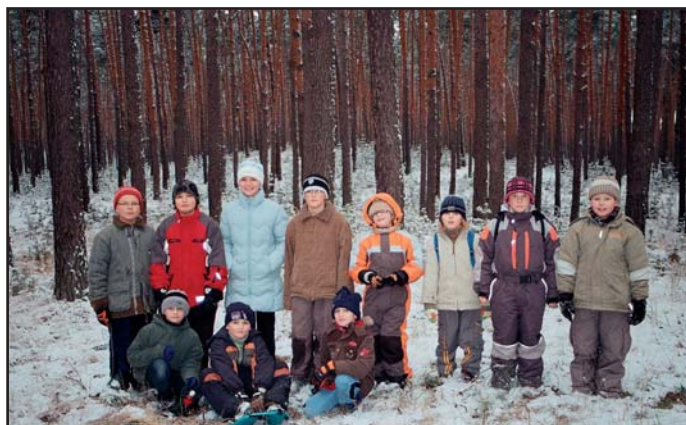
Psí klub-expedice Habánský kopec