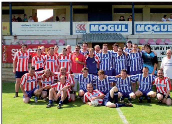
Den farnosti - turnaj ve fotbale