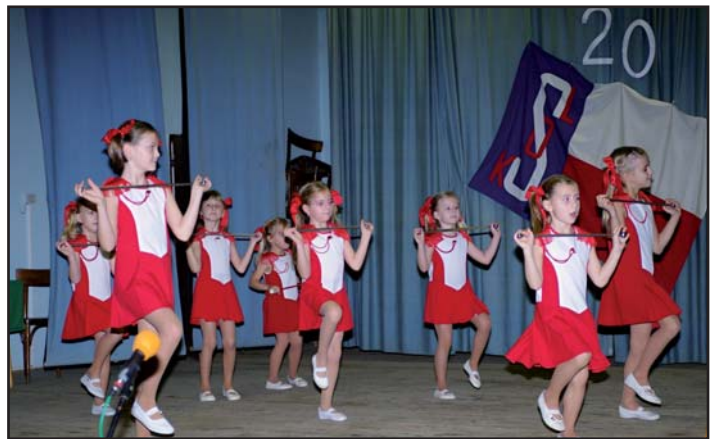
Mažoretky Mini Srdíčka