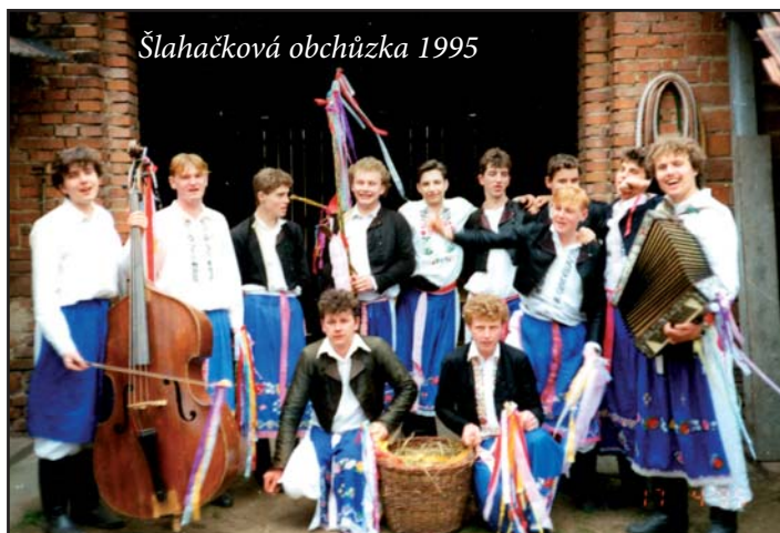
Šlahačková obchůzka 1995

rý byl ukrytý v mladém lese a většina místních lidí o jeho existenci ani nevěděla, vydržel na svém místě téměř šedesát let, až v lednu roku 2007 po řádění orkánu Kyrill došlo k jeho zlomení a pádu. Dílem náhody objevili spadlý kříž v létě toho roku členové Národopisné společnosti Vacenovice, když tudy vedli trasu tradičního Svatojánského pochodu pro děti. Kříž očistili, nakonzervovali a uložili do muzea ve Vacenovicích. Postupem času se zrodila