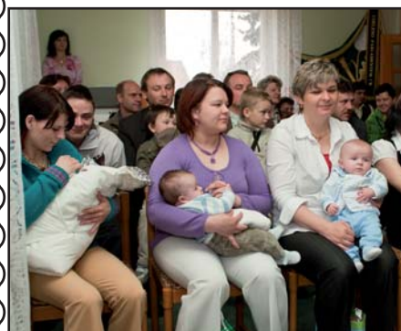
Vítání do života 24. 4. 2010