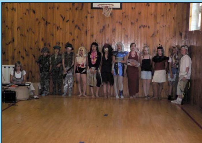
Poslední zvonění 5.třídy ZŠ