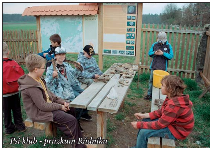
Psí klub - průzkum Rúdníku

Na podzim roku 2009 začal v muzeu pracovat kroužek pro nadané děti Psí klub. Název pochází od pres-