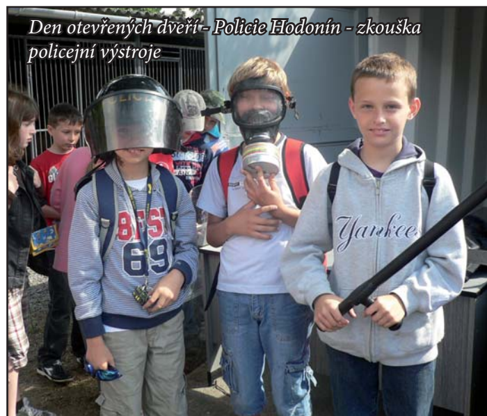
Den otevřených dveří - Policie Hodonín - zkouška policejní výstroje