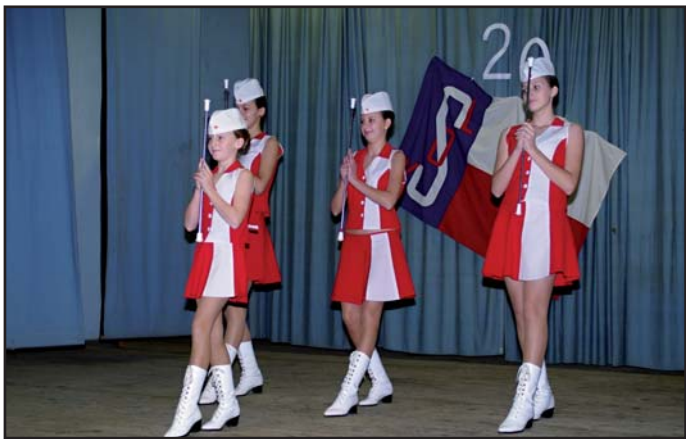
Mažoretky Baby Srdíčka