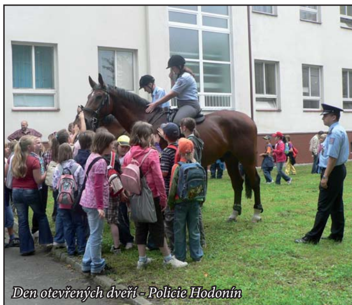
Den otevřených dveří - Policie Hodonín