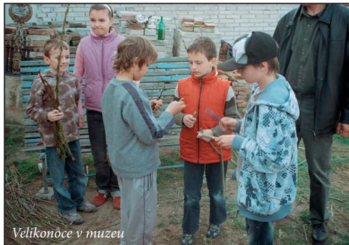
Velikonoce v muzeu