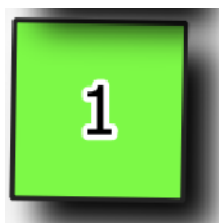
Obr. 2 Ukázka zakreslení volných hrobových míst na mapě hřbitova